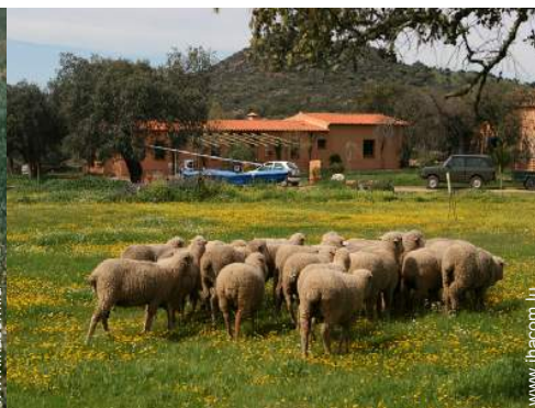
animaux de ferme