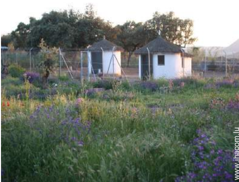
animaux de ferme