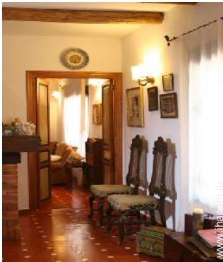
Agencement intérieur à disposition des hôtes