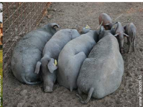
animaux de ferme