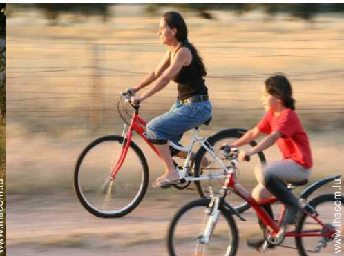
location de vélo/VTT