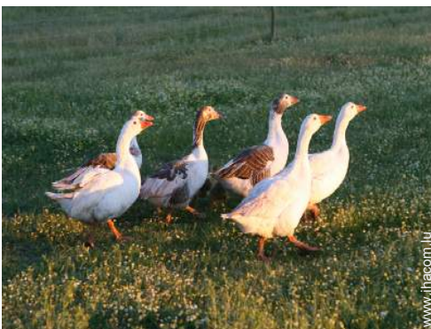
animaux de ferme