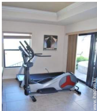
machine(s) de musculation