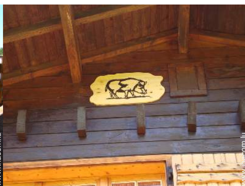
Les animaux de la maison