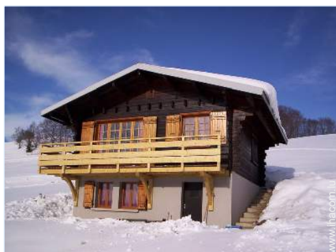
loisirs d'hiver à proximité