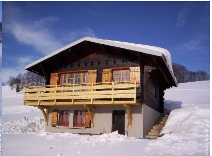
loisirs d'hiver à proximité