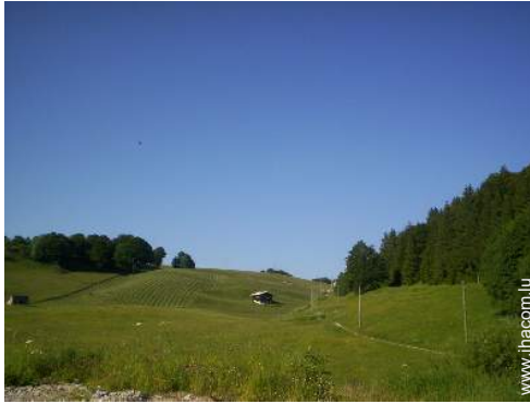
Chalet de Montagne