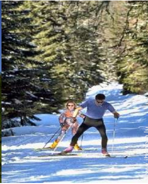
ski de fond