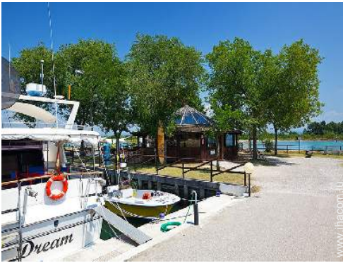
place de bateau au port