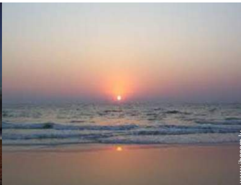
vue sur rue piétonne