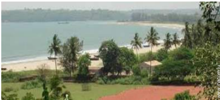
accès direct plage