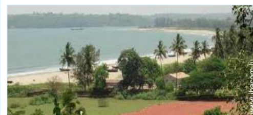
accès direct plage