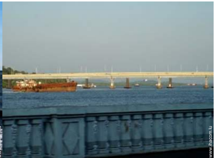
vue sur rivière