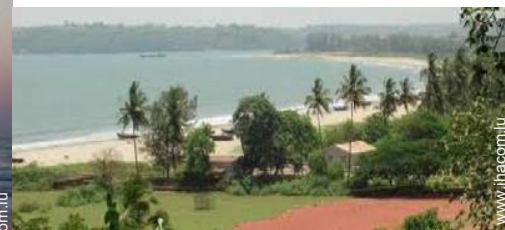
accès direct plage