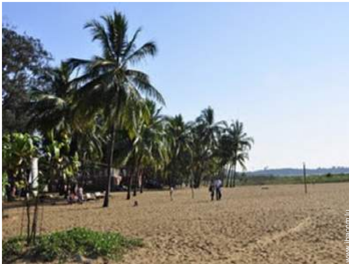
loisirs nautiques à proximité