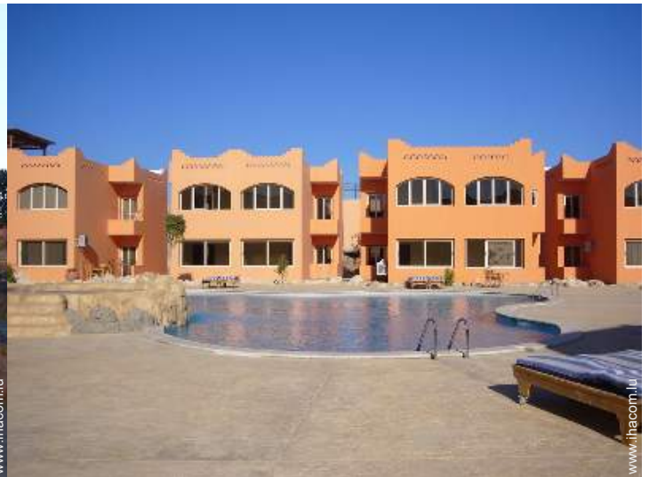
Résidence de standing