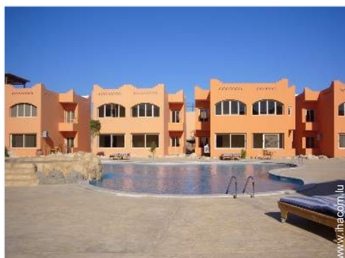
Résidence de standing