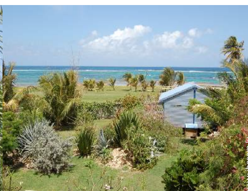
Bungalow de Charme