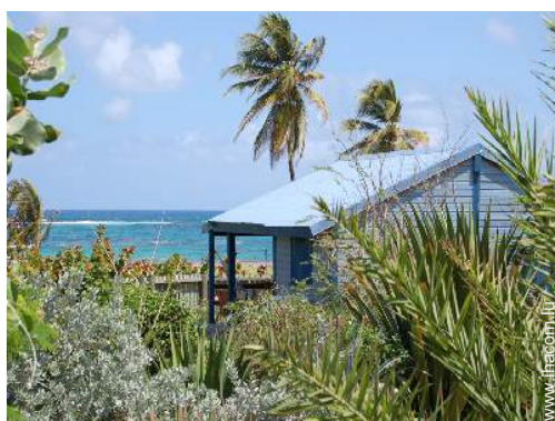
Bungalow de Charme