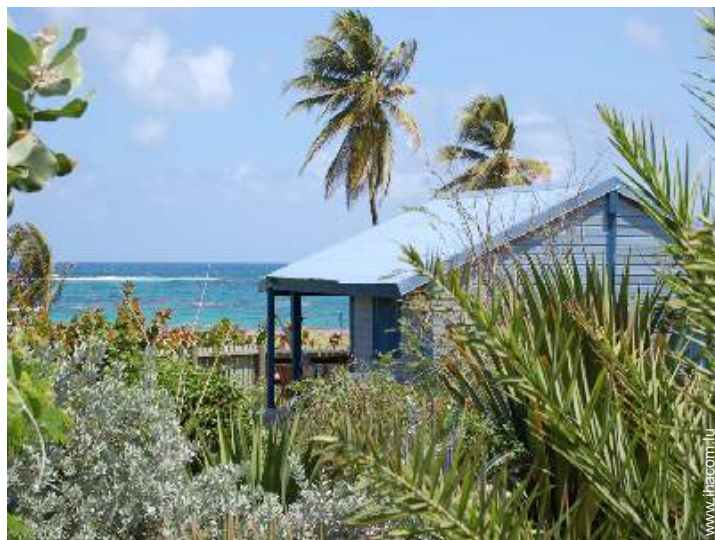
Bungalow de Charme