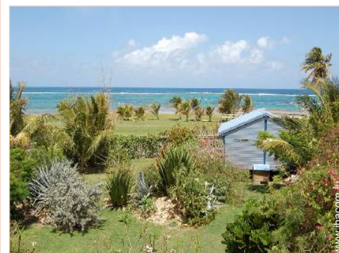
Bungalow de Charme