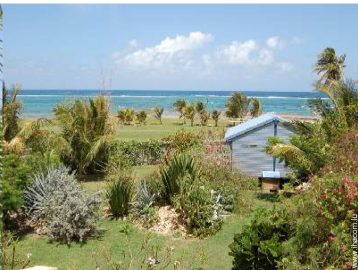
Bungalow de Charme