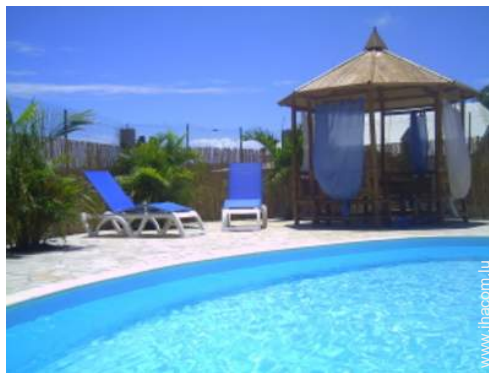
wifi (accès internet sans fil)