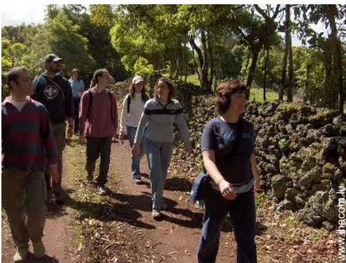
chemin de promenade