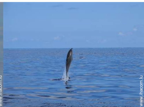
loisirs à proximité