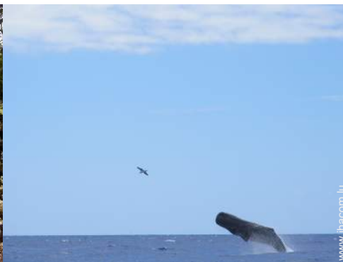
loisirs à proximité