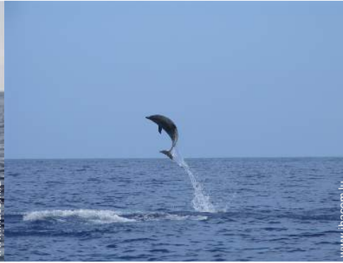
loisirs à proximité