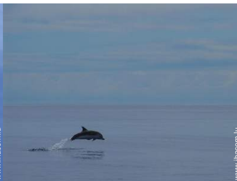
loisirs à proximité