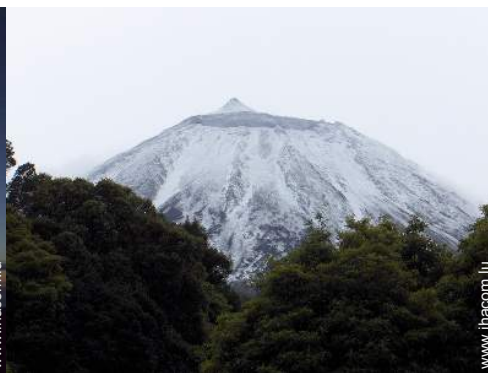
loisirs de montagne à proximité