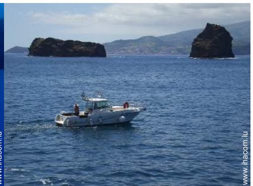
pêche au gros