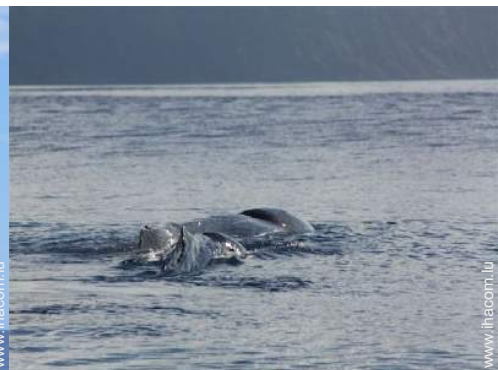
loisirs à proximité