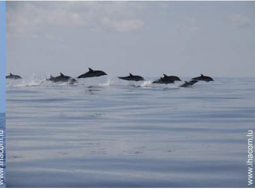
loisirs à proximité