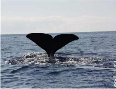
loisirs à proximité