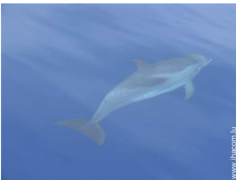
loisirs à proximité