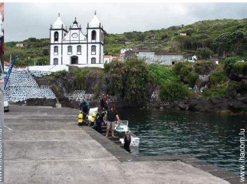
plongée en scaphandre