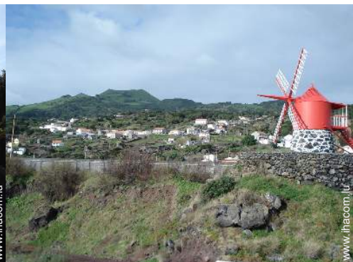
antiquité &#38; brocante