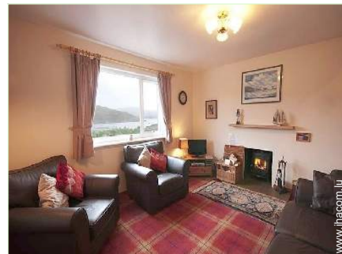
Confort intérieur à disposition des hôtes