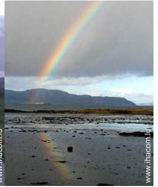
plage de rocher