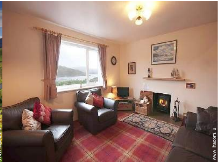
Confort intérieur à disposition des hôtes