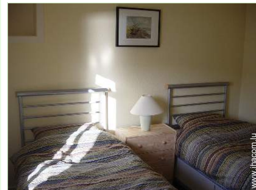
lits jumeaux simple