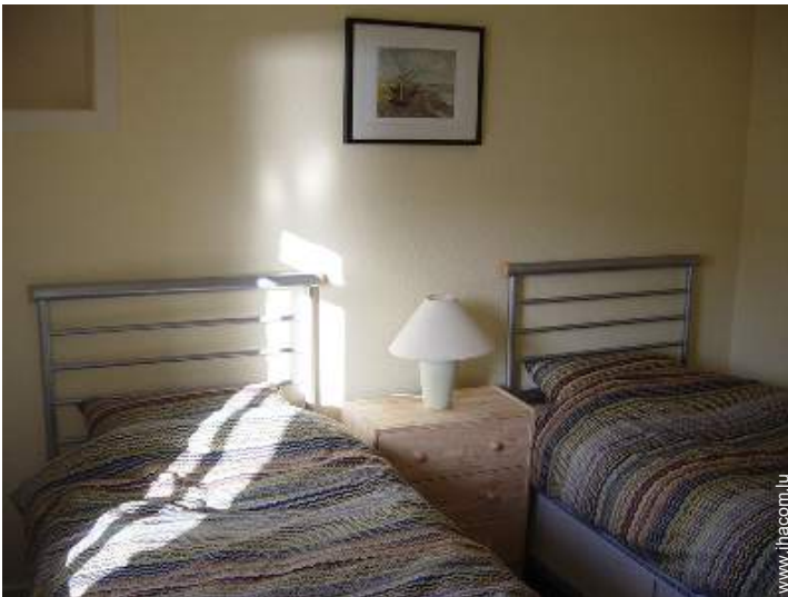
lits jumeaux simple