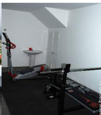
machine(s) de musculation