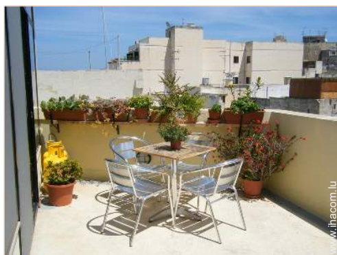
terrasse sur toit