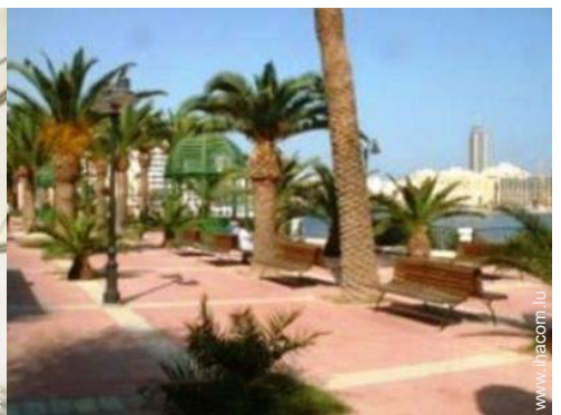
parc et jardin