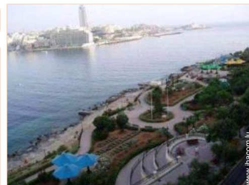
parc de loisirs