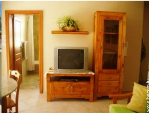
wifi (accès internet sans fil)