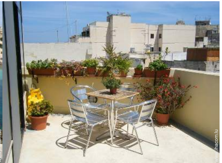
terrasse sur toit