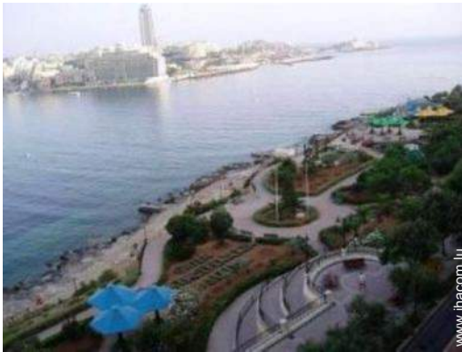
parc de loisirs