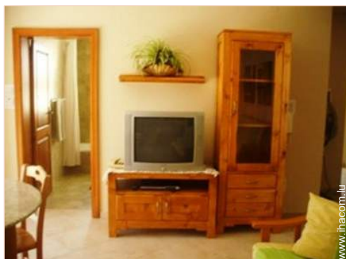
wifi (accès internet sans fil)