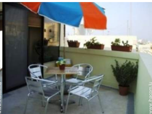
terrasse sur toit