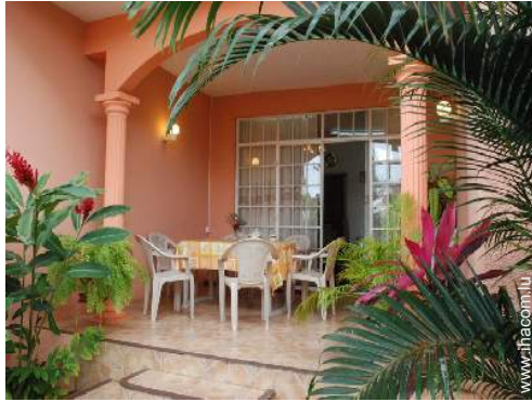
vue depuis la terrasse couverte