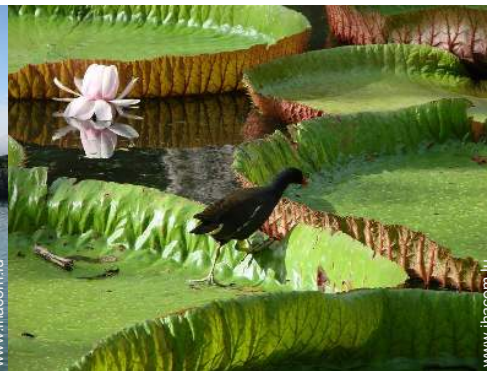
loisirs de montagne à proximité