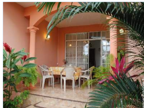
vue depuis la terrasse couverte