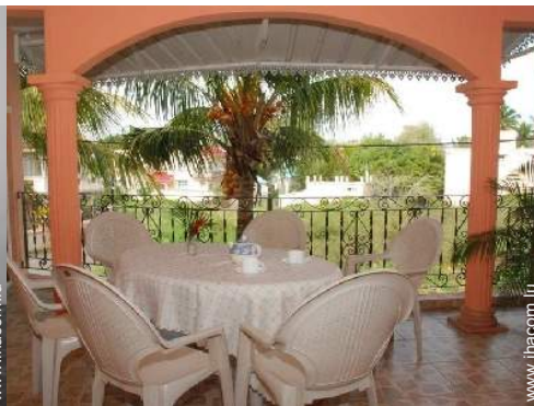
vue depuis la terrasse couverte