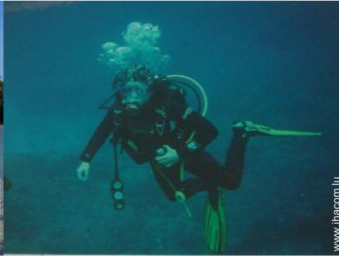
plongée en scaphandre