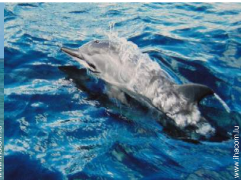
excursion en bateau