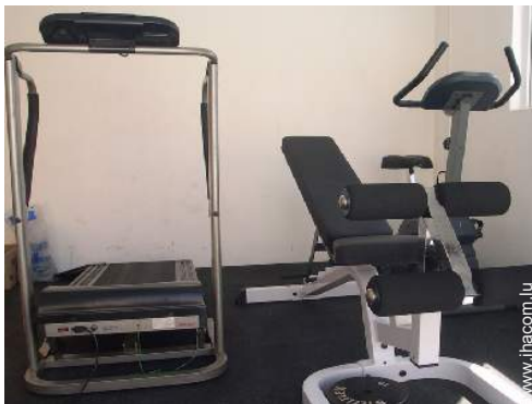
salle de sport