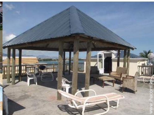
terrasse sur toit