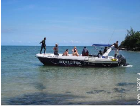
école de plongée