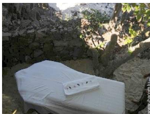
table de massage