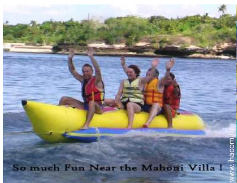
So much Fun Near the Mahoni Villa !