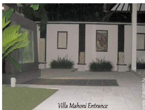
Villa Mahoni Entrance