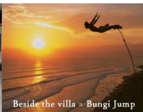
Beside the villa = Bungi Jump