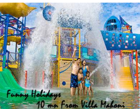
Funny Holidays 10 mn from Villa Mahoni