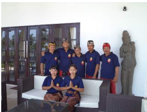
personnel de maison