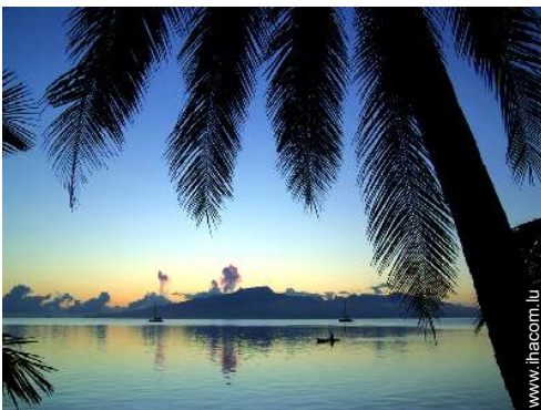
vue sur océan