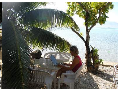
wifi (accès internet sans fil)