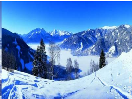
pistes de ski