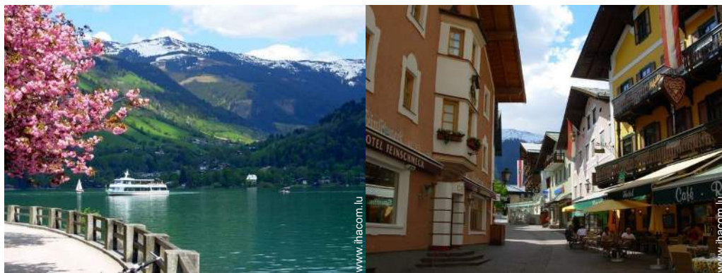
chemin de promenade