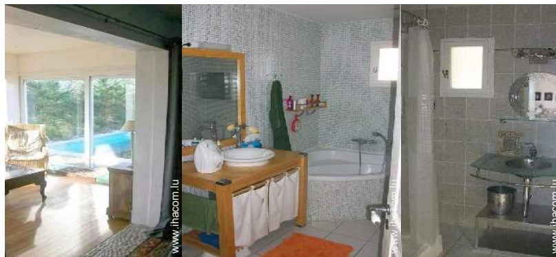
vue depuis la véranda