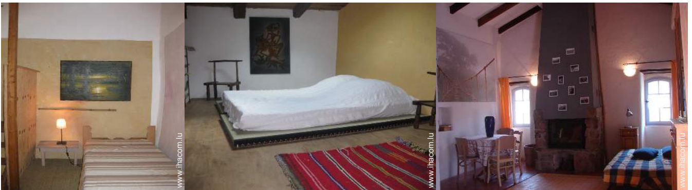
lit(s) futon 2 pers