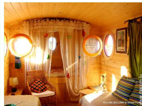
Roulotte de Charme