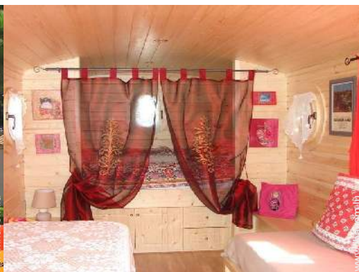
Roulotte de Charme