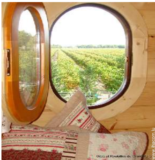
vue sur vignobles