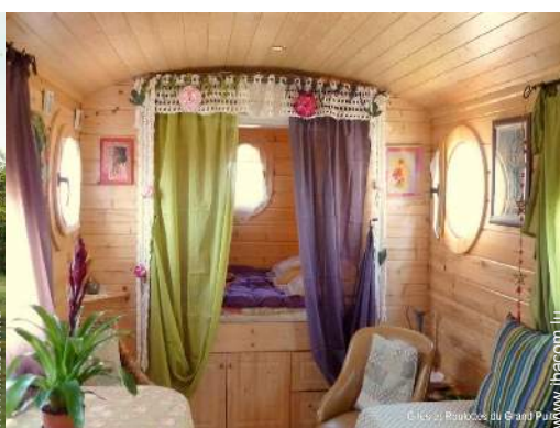
Roulotte de Charme