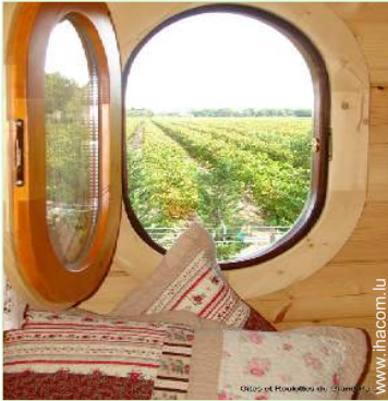
vue sur vignobles