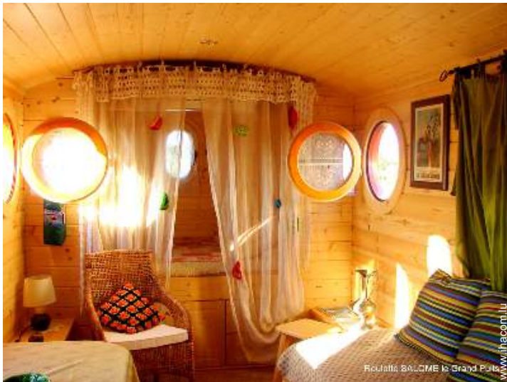
Roulotte de Charme