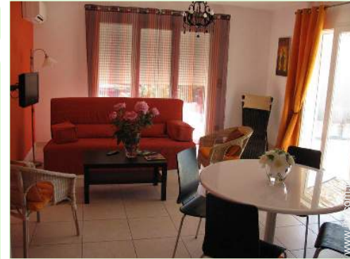
Confort intérieur à disposition des hôtes