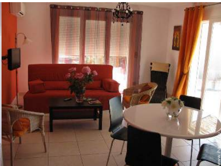
Confort intérieur à disposition des hôtes