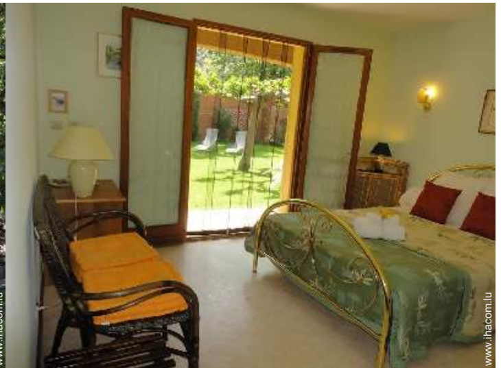
La chambre d'hôte