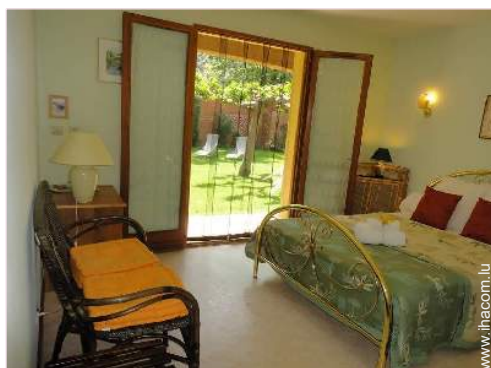
La chambre d'hôte