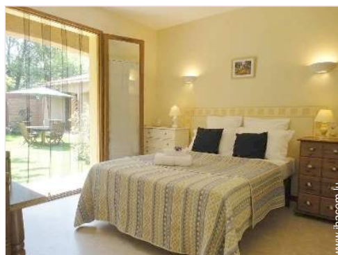
La chambre d'hôte