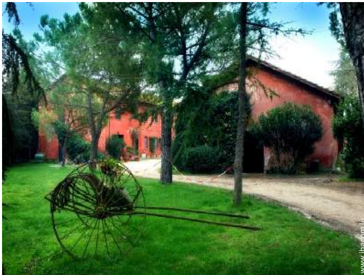
Ancienne Ferme de Charme