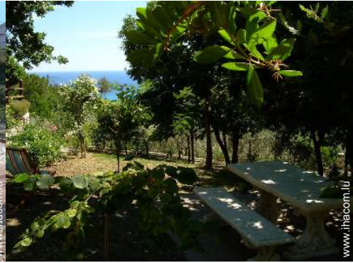
Installation extérieure à disposition des hôtes