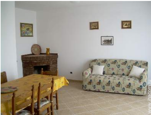
canapé-lit(s) 2 pers