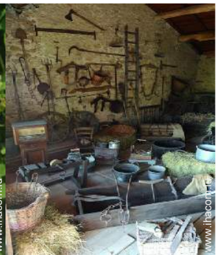
antiquité &#38; brocante