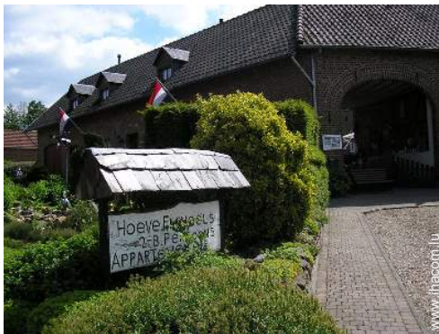
Maison de Campagne de Charme