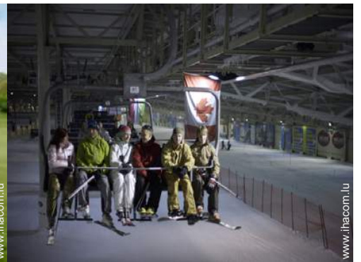
pistes de ski