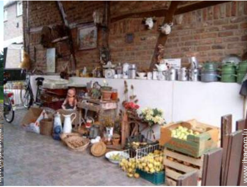
Fermette de Charme