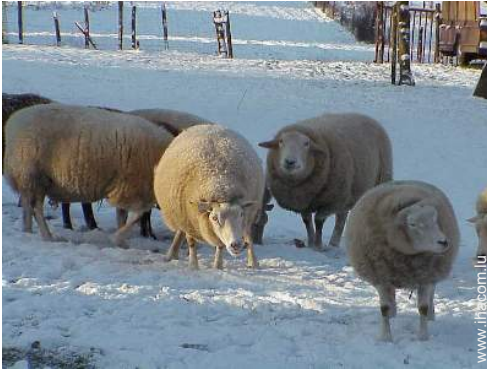
animaux de ferme