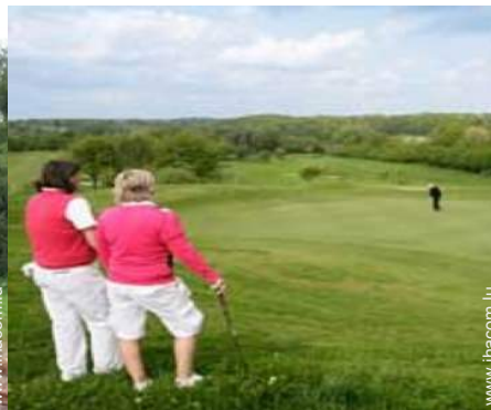
parcours de golf 18 trous