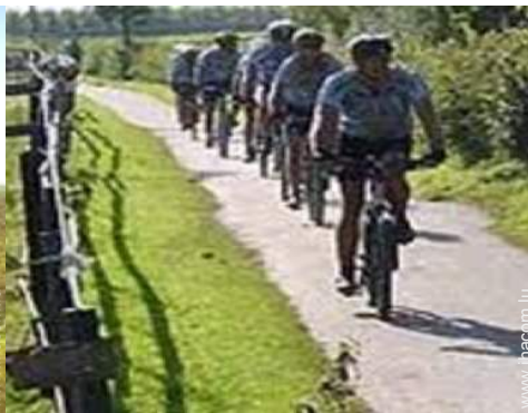
Attraits et détente