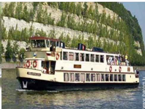
excursion en bateau