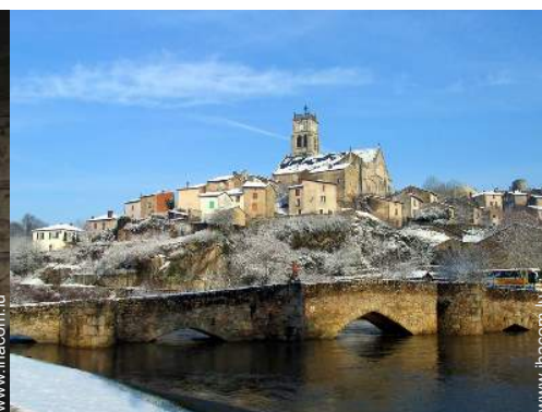
vue sur ville