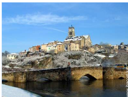
vue sur ville