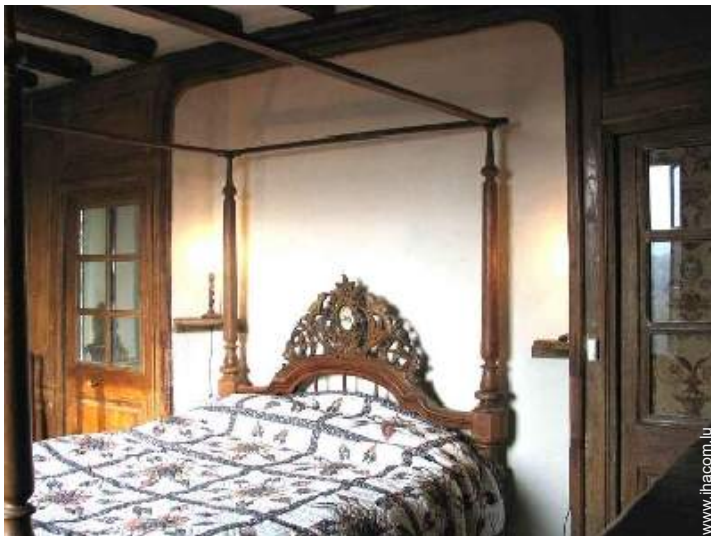
lit(s) double(s) à baldaquin