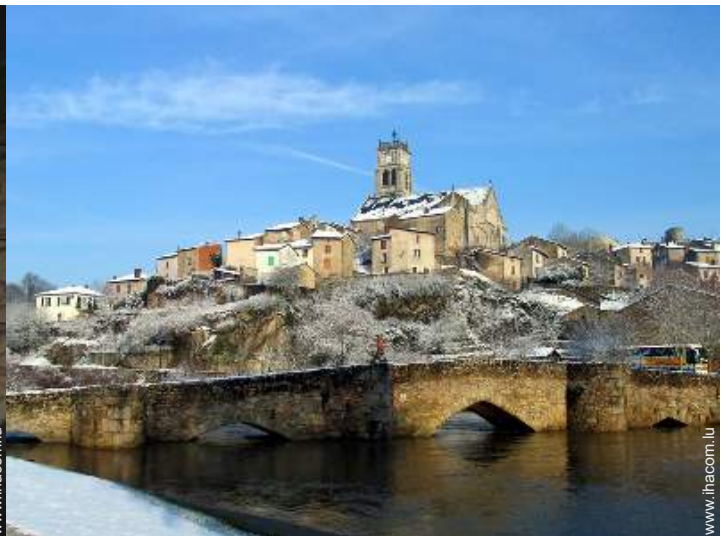
vue sur ville