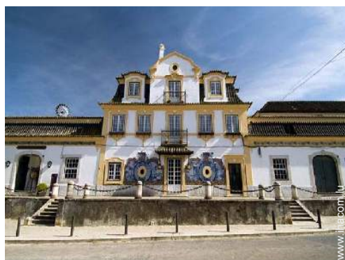
cave et dégustation de vin