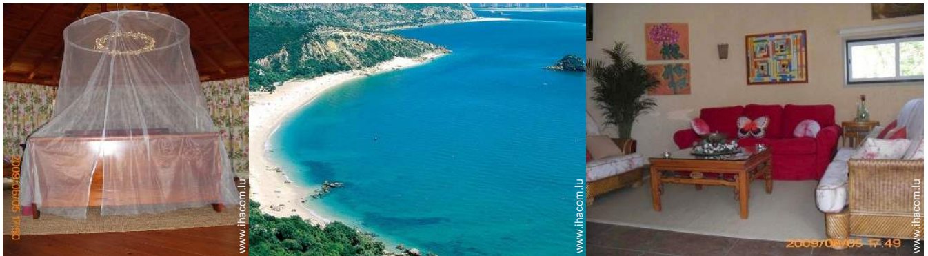
lit(s) double(s) à baldaquin