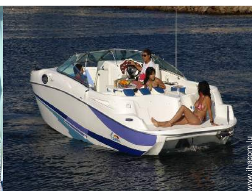
bateau à moteur