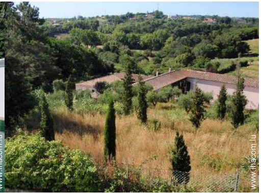
Equipements extérieurs à disposition des hôtes