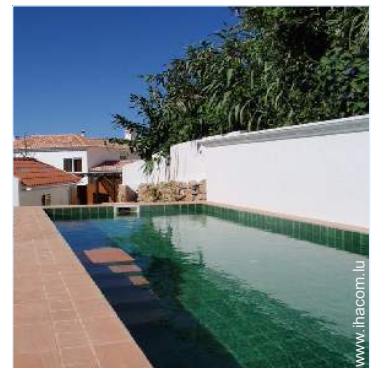
Equipements extérieurs à disposition des hôtes