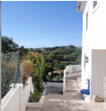
vue depuis le patio