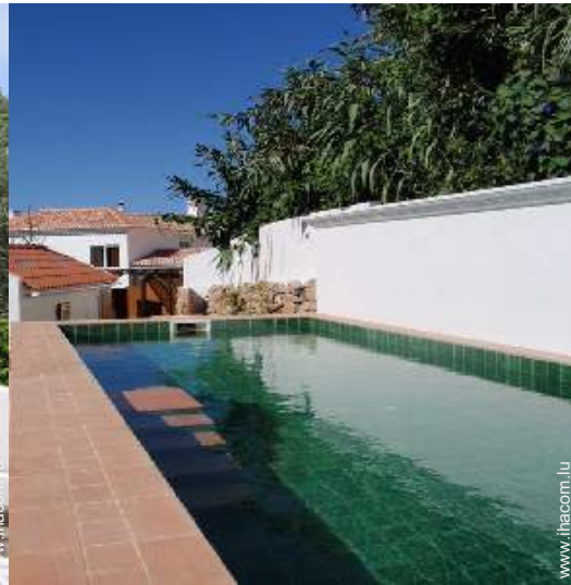
Equipements extérieurs à disposition des hôtes