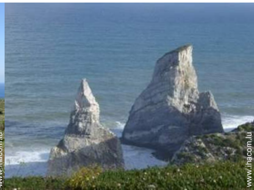
plage de naturisme