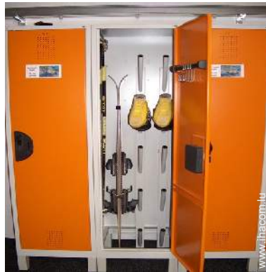
local à ski