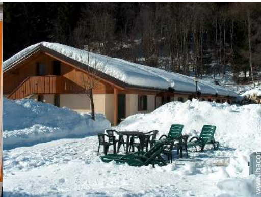
chaise(s) de jardin