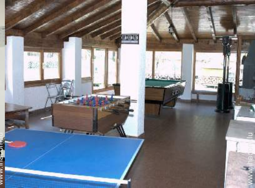
table de ping-pong