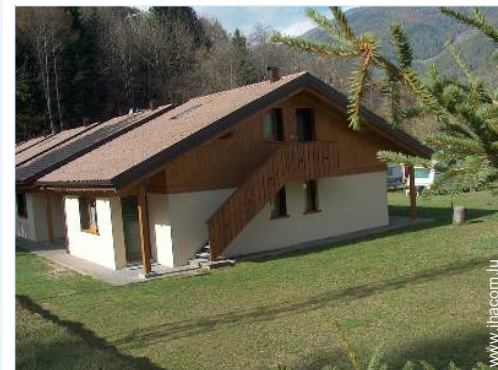
Chalet de Montagne