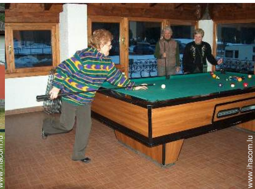
table de billard