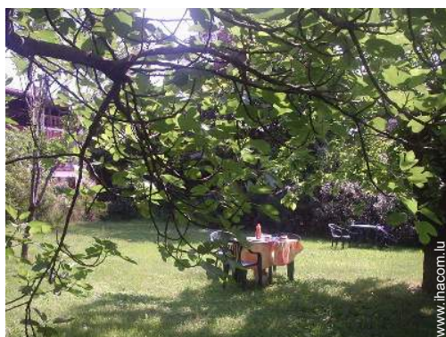
parc et jardin