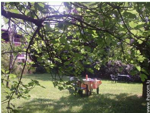
parc et jardin