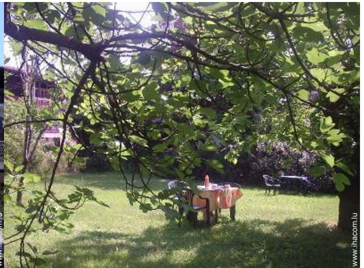
parc et jardin