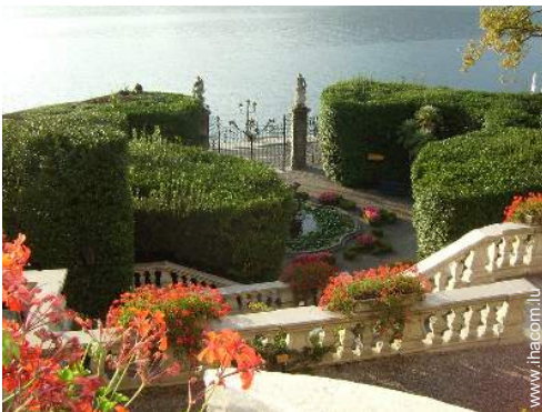
parc et jardin