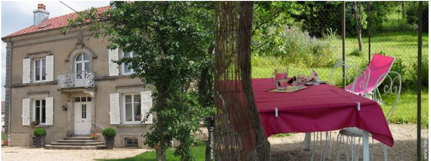
salon de jardin