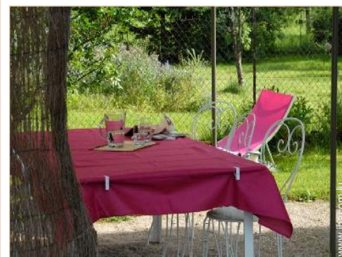
salon de jardin