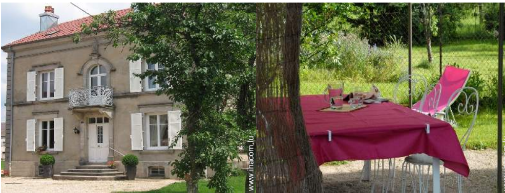
salon de jardin