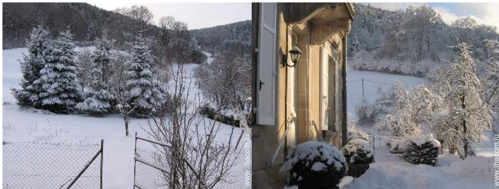
vue depuis la salle à manger