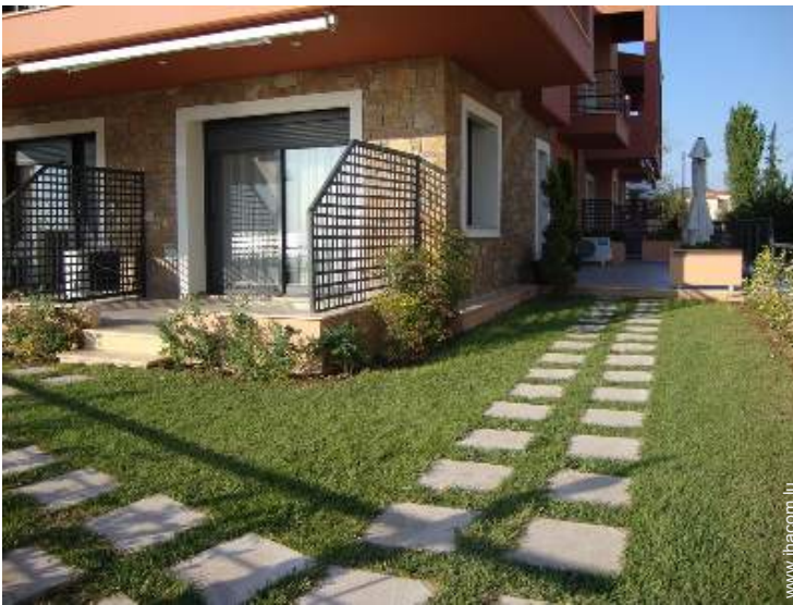
Studio de Charme