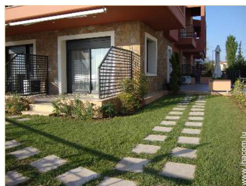
Studio de Charme