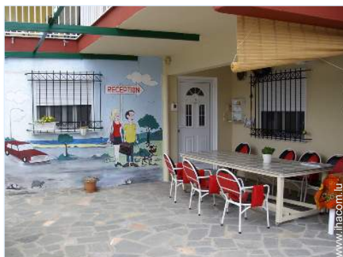
chambre du propriétaire