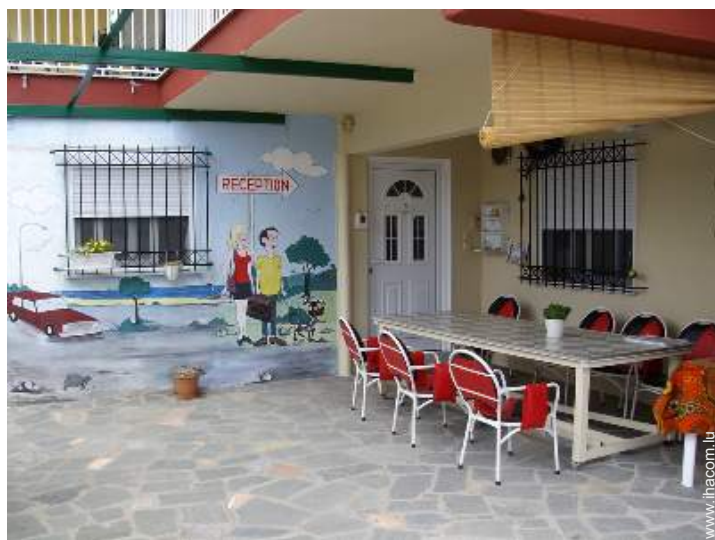
chambre du propriétaire