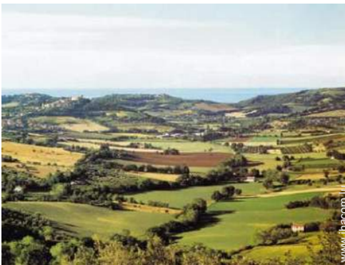
vue sur champs agricoles