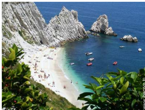
plage de galets