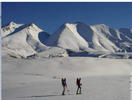
ski de fond