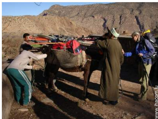
ski de randonnée