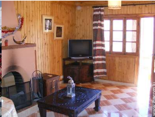
Chalet de Montagne de Prestige