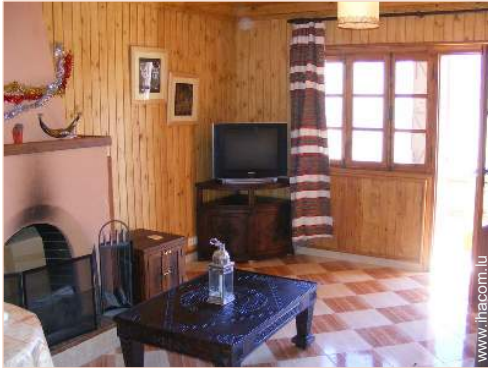
Chalet de Montagne de Prestige