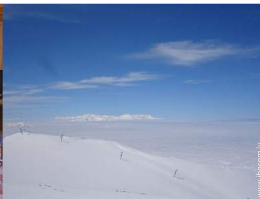
pistes de ski