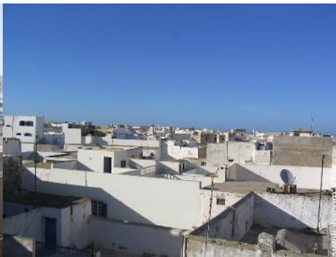
vue sur les toits