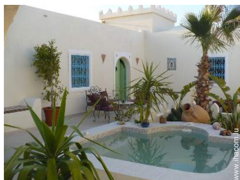
Agencement intérieur à disposition des hôtes