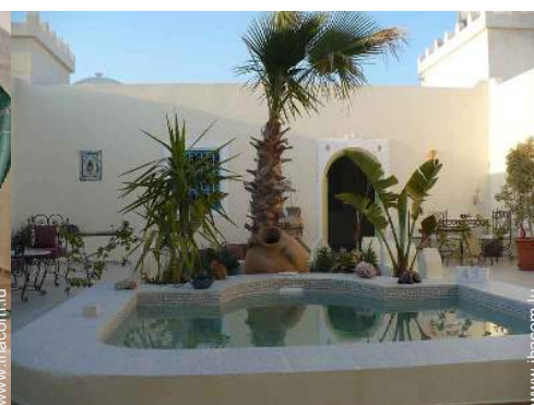
chaise(s) de jardin