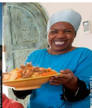
personnel de maison