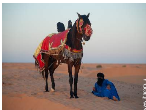
balade à cheval