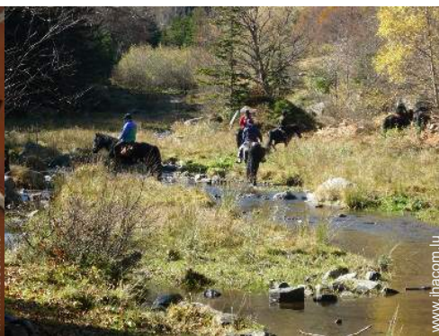
balade à cheval