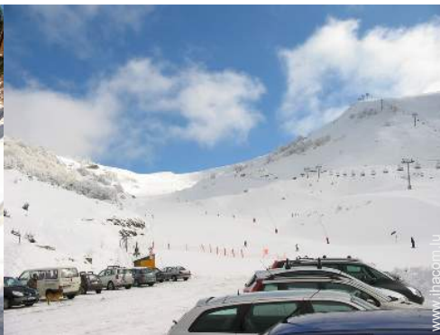
loisirs d'hiver à proximité