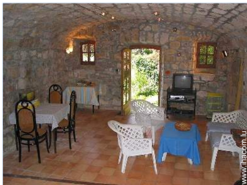
salle de jeux