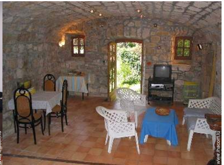
salle de jeux