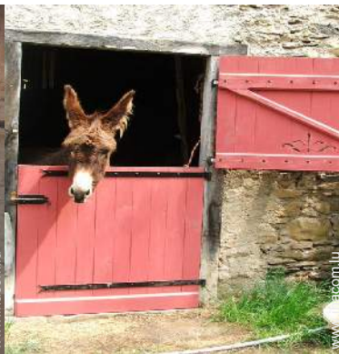
Les animaux de la maison