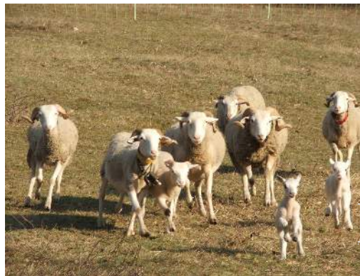
Les animaux de la maison