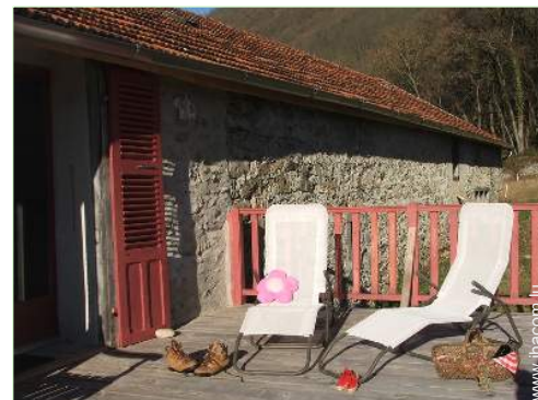
Maison de Charme en Pierre