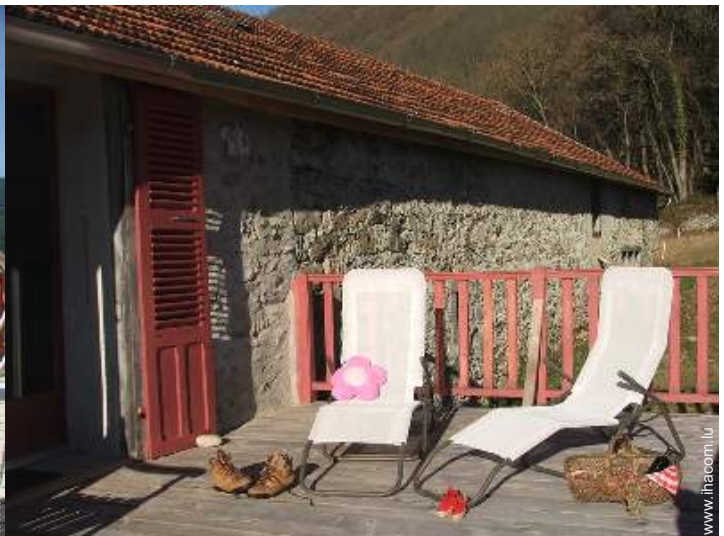
Maison de Charme en Pierre