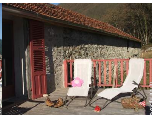
Maison de Charme en Pierre