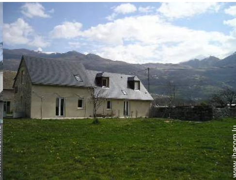
vue sur prairie