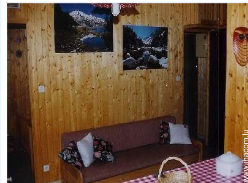
canapé-lit(s) 2 pers