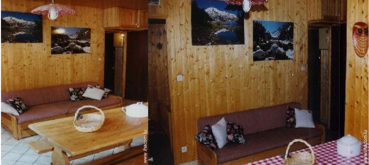
canapé-lit(s) 2 pers